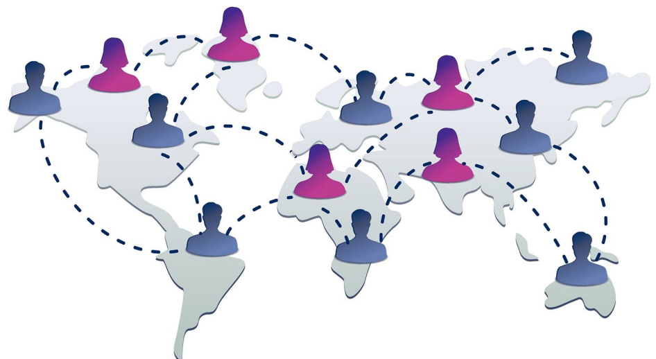
Das Fanpages-Urteil des Europäischen Gerichtshofs hat für Aufsehen gesorgt und hat weitreichende Folgen

Ähnlich hart entschied der Gerichtshof im Fall der Zeugen Jehovas. Zwar konnten die Zeugen Jehovas glaubhaft machen, dass lediglich die einzelnen Missionare dieser Kirche Daten festhalten - etwa nach Missionsgesprächen an der Haustür. Die Kirchenzentrale erhält diese Daten nicht. Weil die Kirche ihren Mitgliedern jedoch Tipps dafür gibt, welche Daten sie möglichst festhalten sollen, ging der Gerichtshof auch hier von einer gemeinsamen Verantwortlichkeit aus.