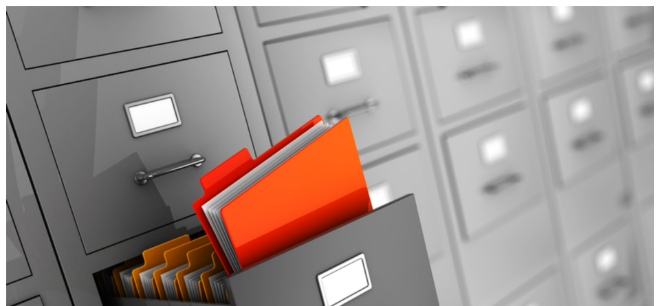
Im Normalfall haben behördliche Sperrvermerke keine Auswirkungen auf die Behandlung der betroffenen Daten im Unternehmen. Es gibt aber Ausnahmen.

Das gilt auch, wenn "befreundete Unternehmen" anfragen, die ebenfalls nach der aktuellen Anschrift suchen.